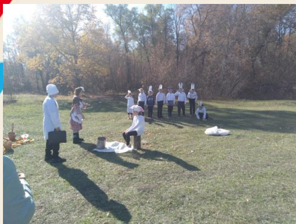
И спектакль поставить не слабо!