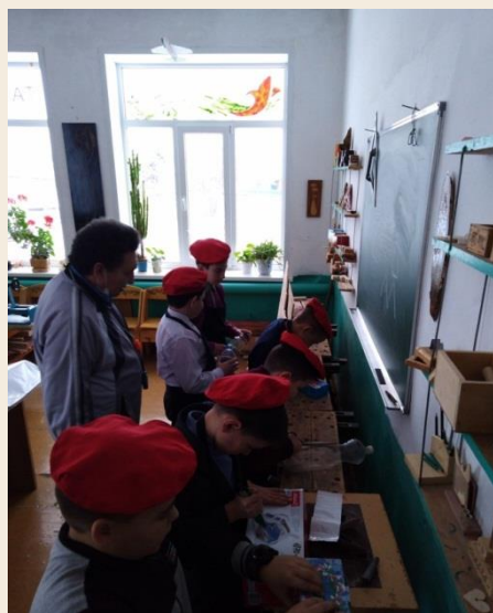
Дело мастера боится. Учимся делать своими руками